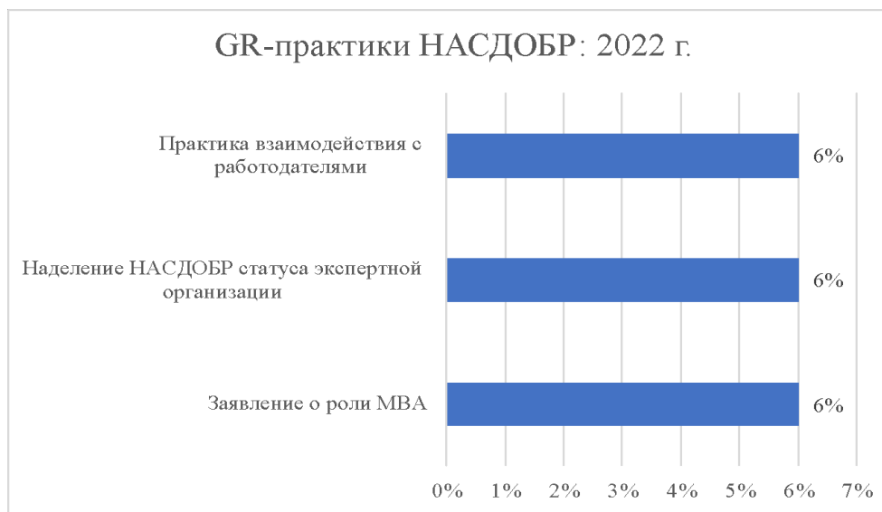
Рисунок 4. Деятельность НАСДОБР: период 2022 г.

Таким образом, во все временные периоды главной остается практика аккредитации экспертов, которые в последующем оценивают качество бизнес-образования. В качестве другой важной меры - продвижение стандартов делового образования для сектора ГМУ. В долгосрочной перспективе это одна из главных мер, поскольку предполагается изменение подхода к подготовке управленцев, необходимость получения ими МВА. Кроме того, остается имиджевая мера НАСДОБР, а именно: участие в российских и международных научных и экспертных конференциях, дискуссиях; практика позиционирования бизнес-образования через интервью.