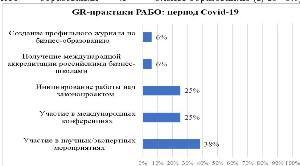
Рисунок 1. GR-практики РАБО: период Covid-19

В период ковидных ограничений число GR-практик снизилось незначительно - 16 практик. Менялись не сами практики, а их форматы - переход в онлайн и новые вызовы перед всей структурой бизнес-образования в РФ (рис. 1). Так, обнаружено видов 5 практик: 1) участие в научных/экспертных мероприятиях (6/16 - 38%); 2) участие в международных конференциях - (4/16 - 25%); 3) инициирование работы над законопроектом (4/16 - 25%); 4) получение российскими бизнес-школами международной аккредитации (1/16 - 6%); 5) создание профильного журнала по бизнес-образованию (1/16 - 6%)