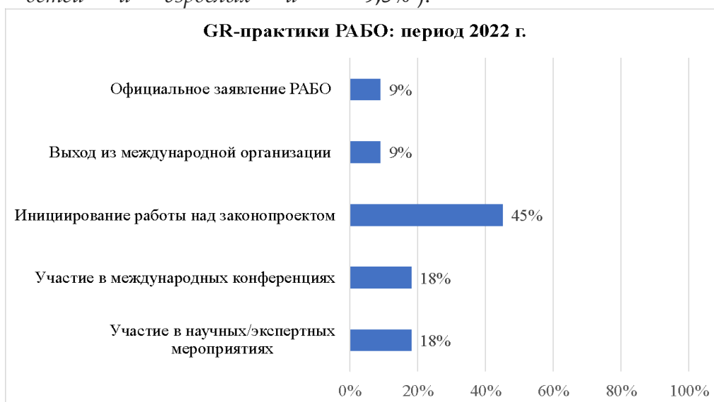
Рисунок 2. GR-практики РАБО: период 2022 г.

В период санкционного давления число GR-практик также снизилось - 11 практик. Среди форматов сохранились как и те, что были ранее, так и добавились новые (рис. 2). Было выявлено 5 видов практик: 1) участие в научных/экспертных мероприятиях (2/11 - 18%); 2) участие в международных конференциях - (2/11 - 18%); 3) инициирование работы над законопроектом (5/11 - 45%); 4) выход из международной организации (1/11 - 9,5%); 5) официальное заявление РАБО (1/11 - 9,5% ).